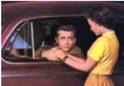
James Dean en Natalie Wood in Rebel without a cause

tolerantie voor het afwijkend gedrag van jongeren wordt daar gedeeltelijk door bepaald." Bij sommige bekende en extreme gevallen, zoals in Columbine, verwijst men graag naar schadelijke invloeden op de moderne jeugd, zoals gewelddadige games en muziek. Ook hier moet men echter opletten voor het trekken van conclusies: