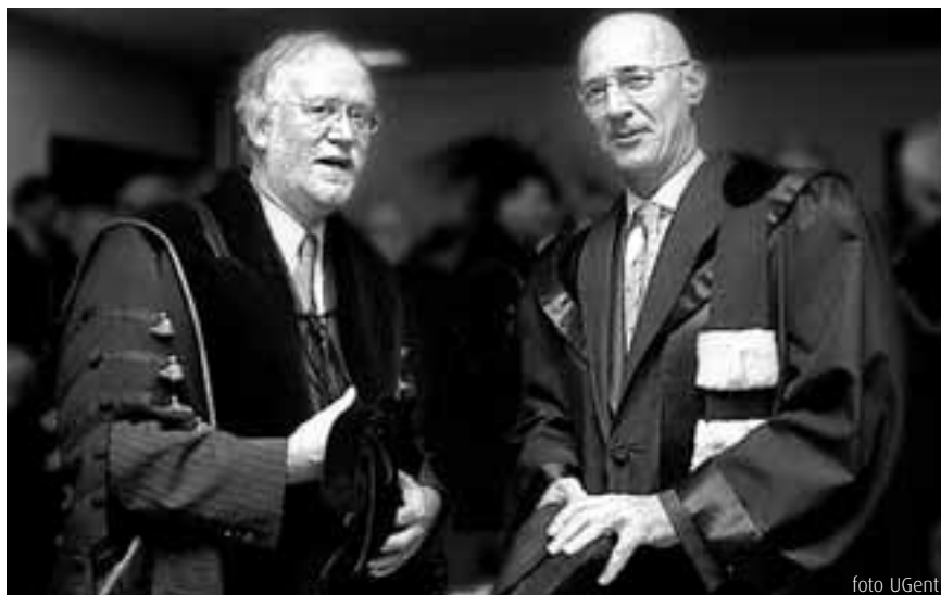
rector Van Cauwenberge (UGent) en rector Van Camp (Vrije Universiteit Brussel)

OP 5 JUNI TEKENDEN DE VRIJE UNIVERSITEIT BRUSSEL EN DE UNIVERSITEIT GENT EEN INTENTIEVERKLARING TOT STRUCTURELE SAMENWERKING. DE UNIVERSITEITEN MIKKEN MET DEZE ALLIANTIE OP EEN VERSTERKING VAN HET ONDERZOEK, ONDERWIJS EN EFFICIËNTERE INZET VAN DE MIDDELEN.